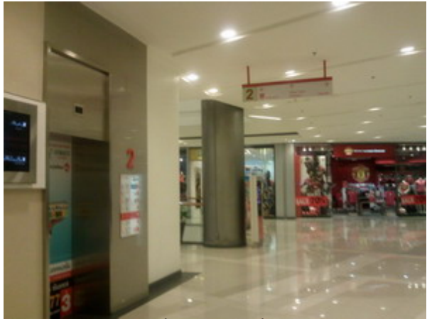
ขึ้นลิฟท์ จากชั้น 2