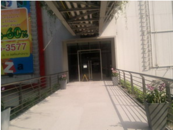
ทางเข้าจากอาคารจอดรถ ชั้น 2 โซน B

จอดรถที่อาคารจอดรถด้านหลัง ชั้น 2 โซน B เข้าสู่ศูนย์การค้าฯ ที่ ชั้น 2 โซน B (เนื่องจากชั้นอื่นยังไม่เปิด) เดินตรงเข้ามา จะเจอลิฟท์ทางขวามือ ขึ้นลิฟท์ จากชั้น 2 มาที่ชั้น 7 Education Zone ออกจากลิฟท์แล้วย้ายจะเห็นร้าน HAPPY HOME สอบถามเพิ่มเติม....คุณแสงรวี 083-903-9956