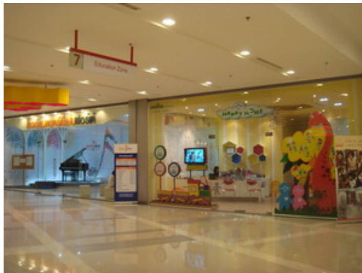
ชั้น 7 Education Zone ออกจากลิฟท์แล้วย้ายจะเห็นร้าน HAPPY HOME